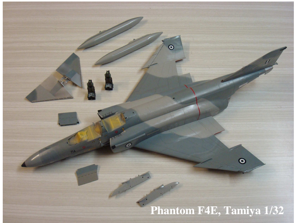
Phantom F4E, Tamiya 1/32

Nächster Treff 24. Februar Hotel zum Alten Bahnhof Gossau SG