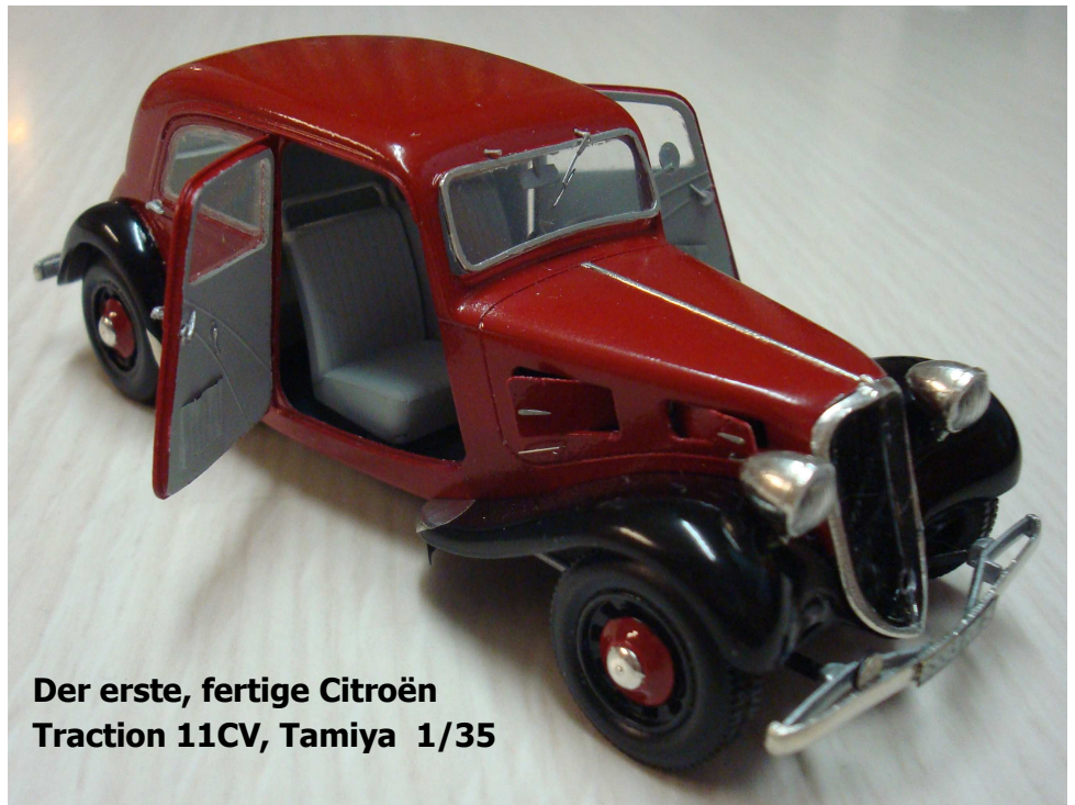
Der erste, fertige Citroën Traction 11CV, Tamiya 1/35

Nächster Treff 20. April Restaurant Erlengolf 8586 Erlen TG